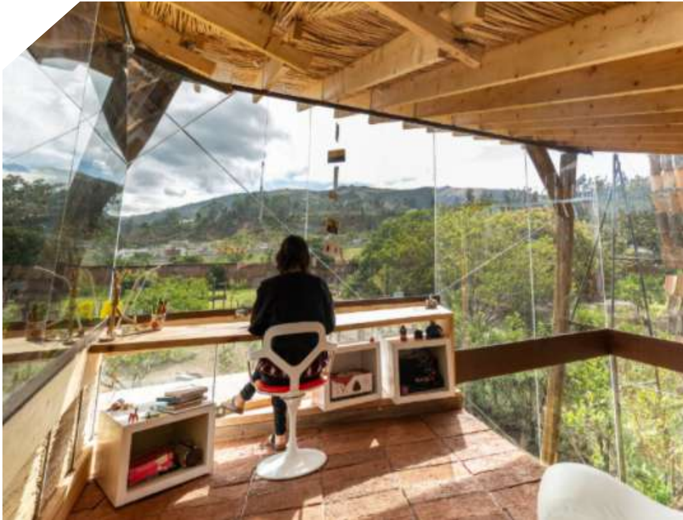
Jag Studio - House of flying tiles by Daniel Moreno Flores