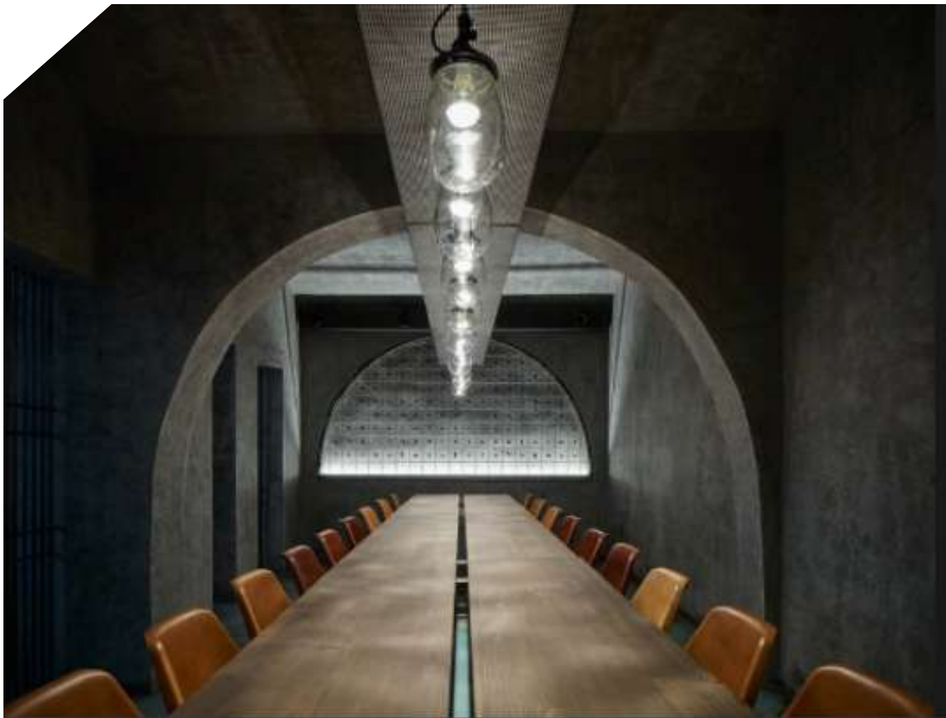
BoysPlayNica, Il ristorante argentino Gran Fierro a Praga