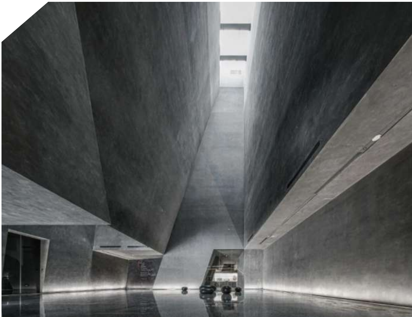
Atelier Alter Architects, Yingllang Stone Natural History Museum